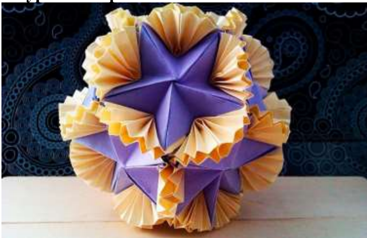
Кусудاما из роз